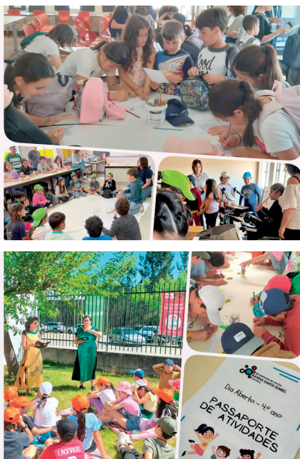
visitantes experimentar desafios divertidos,

Cada estação do percurso ofereceu atividades lúdico-didáticas, preparadas por docentes de várias disciplinas, que permitiram aos